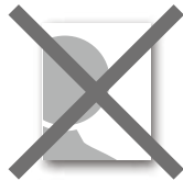
ヘアスタイル全体が見えない